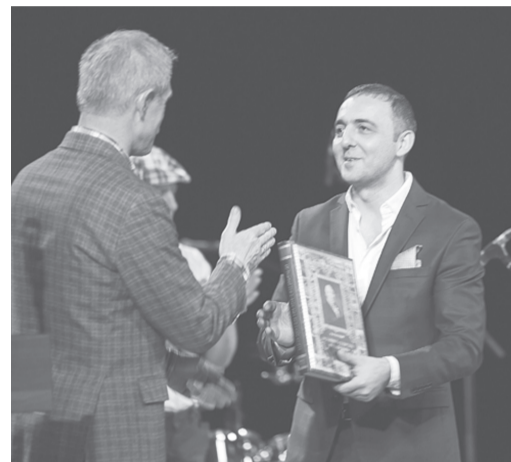
Книга о Карамзине - губернаторский подарок к празднику

Затем слово взял главный раввин Ульяновска Иосиф Марозов, который после традиционного «мазелтоф» с неповторимым акцентом, не скрывая волнения, произнес свою речь. Он заявил, что Ульяновск - это город, в котором «толерантность - это не просто слова», в котором нет антисемитизма. Он отметил вклад губернатора Сергея Морозова в развитие межнациональных и межконфессиональных отношений, назвав их в качестве примера для других регионов.