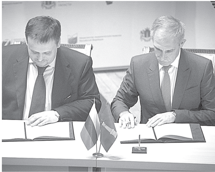
Подписи под соглашением между АСИ и правительством региона поставили руководитель агентства Андрей Никитин и губернатор Сергей Морозов.

Проект компании «Сурская рыба» включает возведение трех комплексов: товарно-производственного закрытого комплекса УЗВ с производством товарной рыбы в 2 - 2,5