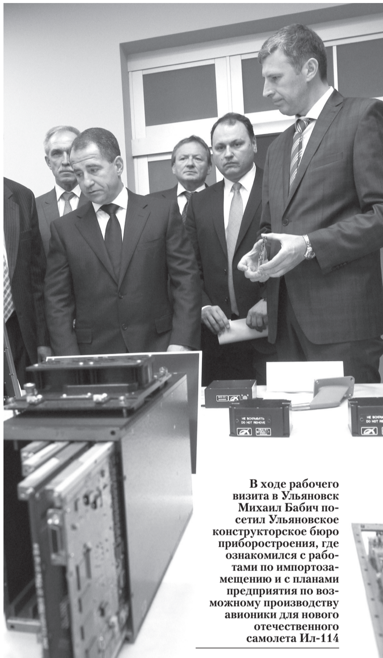
В ходе рабочего визита в Ульяновск Михаил Бабич посетил Ульяновское конструкторское бюро приборостроения, где ознакомился с работами по импортозамещению и с планами предприятия по возможному производству авионики для нового отечественного самолета Ил-114

Рейтинг АСИ Михаил Бабич назвал индикатором того, как разные регионы при равных возможностях осуществляют работу с инвесторами: